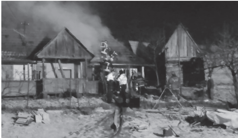
Iszlóban is megfékeztek a tüzet, de a ház tulajdonosa már érkezésük előtt meghalt

A csikfalviaknak tavaly január 22-én volt a mostani, iszlóihoz hasonló esetük, akkor is Jobbágytelkére szálltak ki, ahol egy túlterhelt villanymelegítő rövidzárlata okozott tüzet egy ugyancsak egyedül élő, ágyhoz kötött idős férfi házában, aki valószínűleg szintén füstmérgezésben halt meg, de az ő teste nagyon megégett a tűzben, sőt a ház égő gerendázata is rászakadt, amikor az ajtóig próbált eljutni.