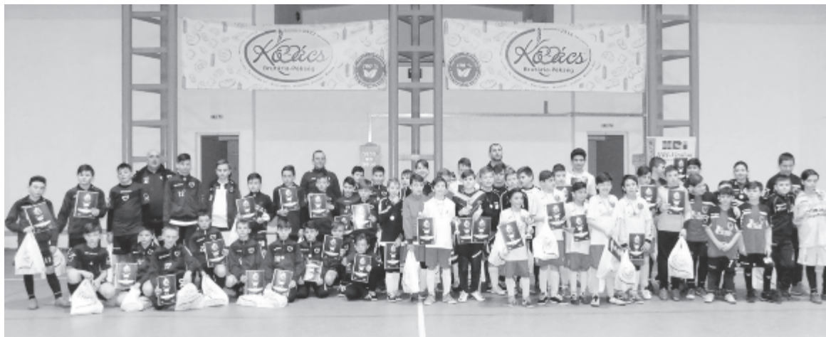
Csoportkép a 2005-ös korosztály díjkiosztó ünnepségén részt vevőkkel.

Hat korosztály számára rendezik meg gyereklabdárúgásban az idén először kiírt Kovács Pékség Kupát, amelyet sportvonalon a Marosvásárhelyi MSE, adminisztratív vonalon a megyeszékhelyi klub tevékenységét segítő Pro MSE Egyesület szervez. Az első két korosztály küzdelmei az elmúlt hét végén zajlottak: a 2005-ben születettek a marosszentannai sportteremben, míg a 2007-es korosztályos csapatok Jeddén mérték össze az erejüket.