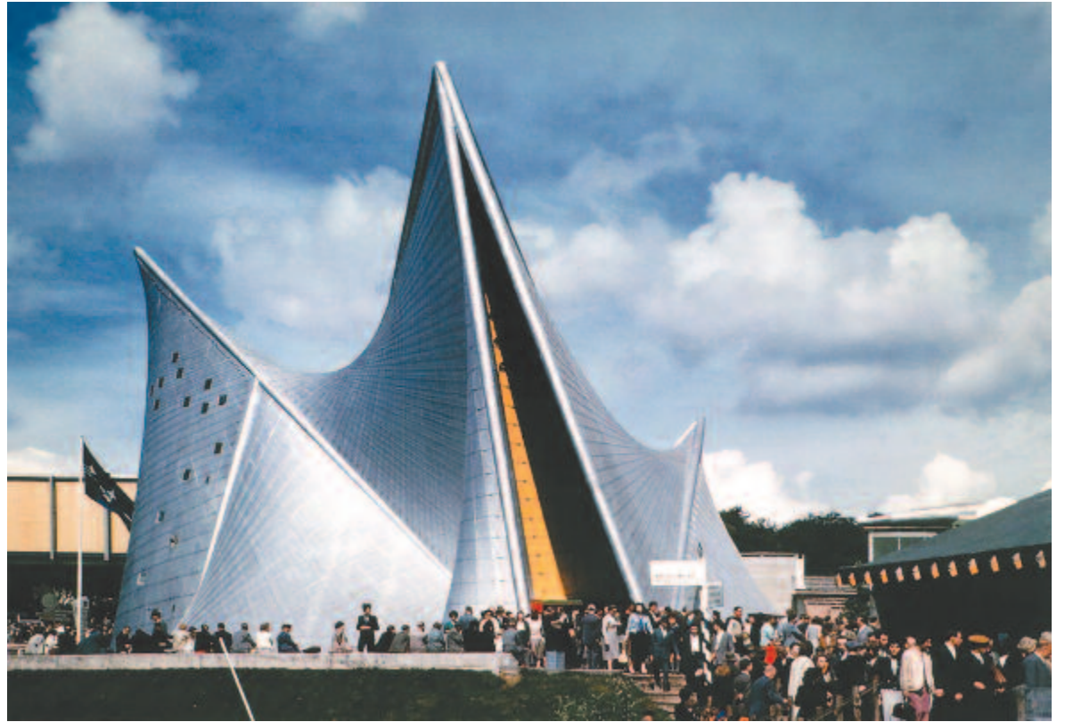
A Xenakis által tervezett Philips Pavilon

Xenakis egyáltalán nem volt érzéketlen ember művészi szempontból sem. Bár sok műve többszörösen elvontnak tekinthető, mégis találunk néhány olyan zongoradarabot, amely diszkréten árulkodik lírai gondolatairól.