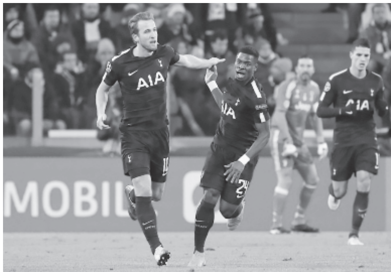
Londoni öröm: az angol csapat kétfős hátrányból egyenlített Torinóban